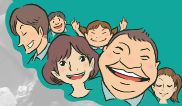
背景写真：オーケストラの日2014 (兵庫芸術文化センター管弦楽団)