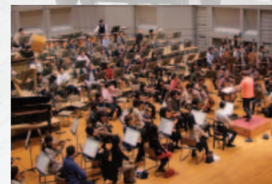
東日本大震災で統合・閉校された小学校の校歌録音風景 (東京フィルハーモニー交響楽団)