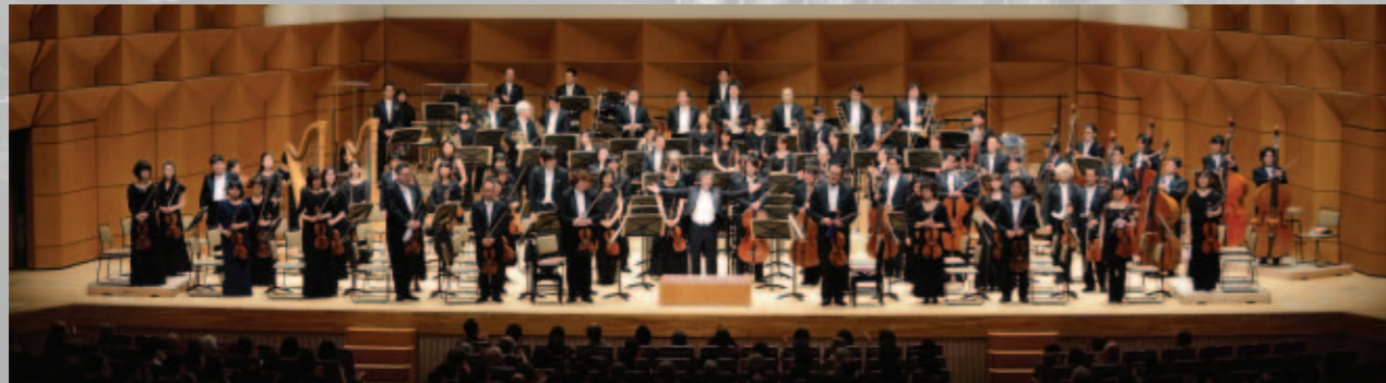
オーケストラの日2015 (首都圏合同)

日本の33団体のプロ・オーケストラは一年間に3,800回の演奏会を行い、425万人の方々に楽しんでいただいています。この活動に最小限必要な経費は263億円ですが、この内、オーケストラ独自で賄える金額は約半分142億円が限度です。不足する資金の24%は国・地方自治体などからの公的支援、20%は企業や個人など民間の皆さんからのご支援、3%はその他の収入です。しかし、より良い活動を行うには263億円以上の資金が必要となります。独自で稼ぎ出す限度が142億円なので、120億円以上のご支援がないと成立しないこととなります。425万人以上の国民に質の高い演奏を楽しんで頂くためにも、今以上のご支援をお願いする次第です。