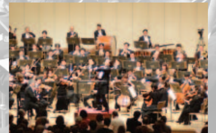
オーケストラの日2013 (首都圏合同)

日本のオーケストラは、明治時代に西洋文化を取り入れ始めた折より、受け継がれ、発展して参りました。今や世界でトップクラスと評されるまでに成長を続けています。この目覚ましい発展は日本国内だけではなく、広大なアジア地域全体の音楽文化発展の牽引力ともなっています。国境や言語を越えて人々の心をつなぐことは容易ではありませんが、オーケストラが持つ大いなる可能性は次世紀に向けますます重要なものとなって行くでしょう。